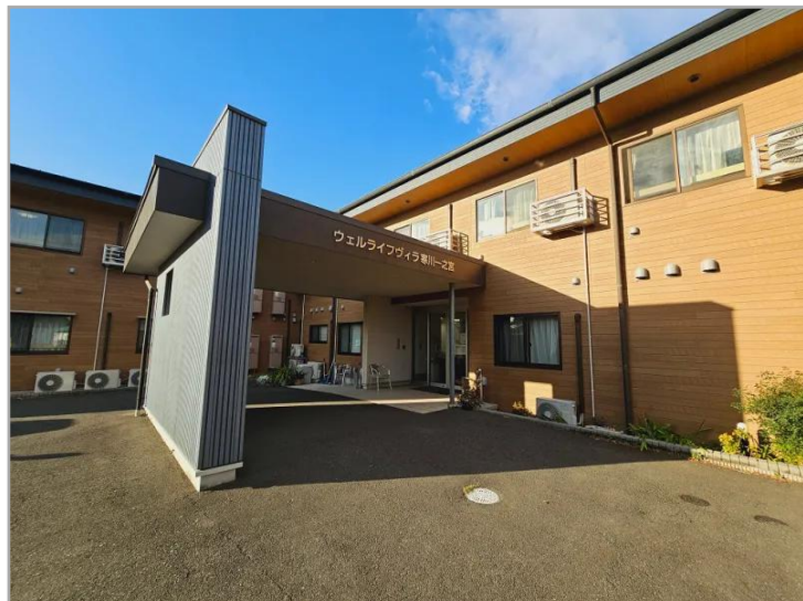
【ウェルライフヴィラ寒川一之宮】外観