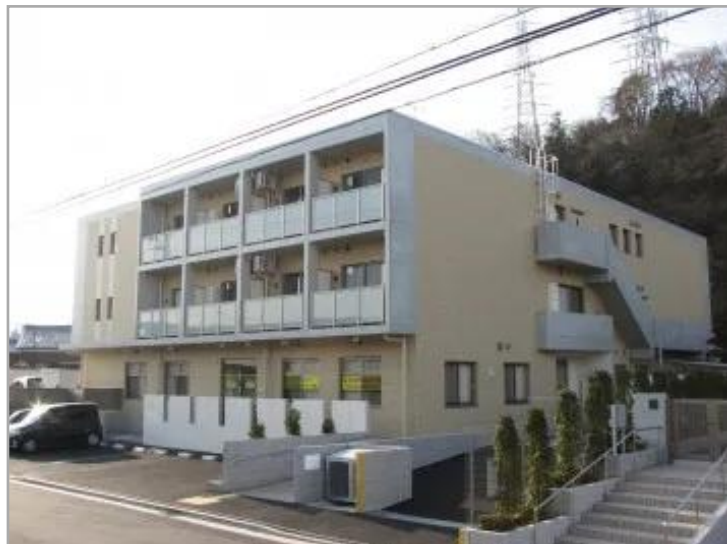
【ミモザ白寿庵大倉山】外観