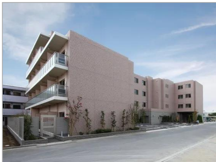
そんぽの家S北戸田 お洒落な外観