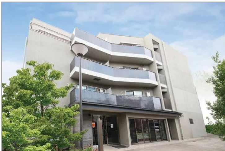
【福寿こがねい緑町】 外観