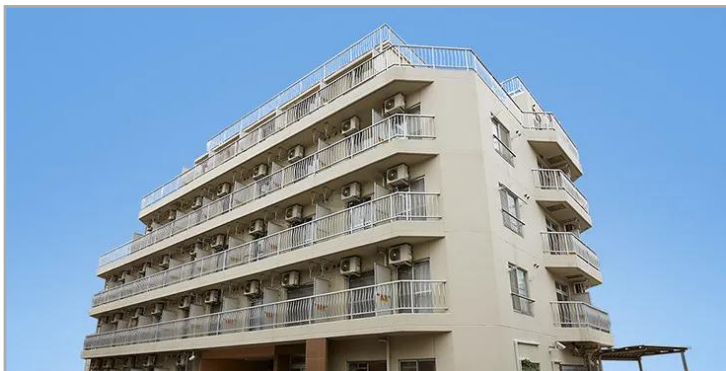
【寿らいふときわ台】外観