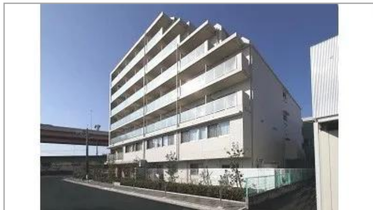
そんぽの家S 扇大橋 外観