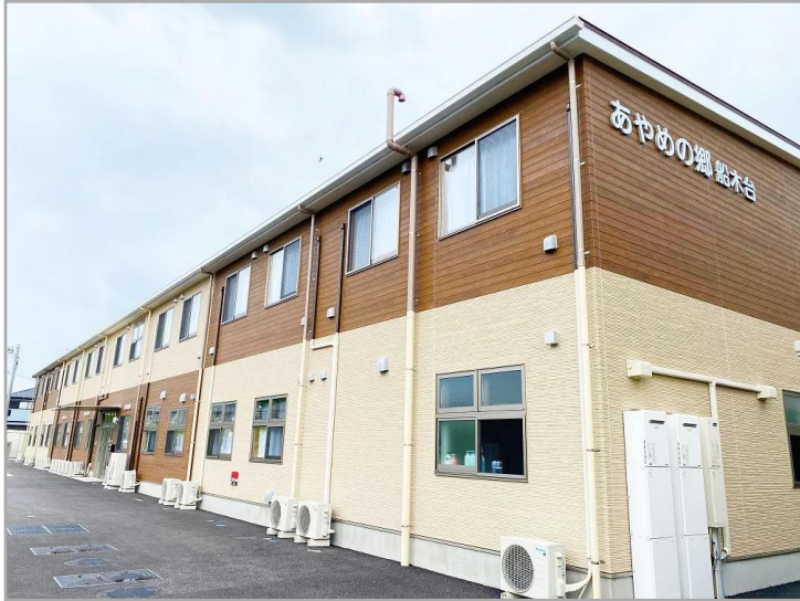
【あやめの郷船木台の外観】