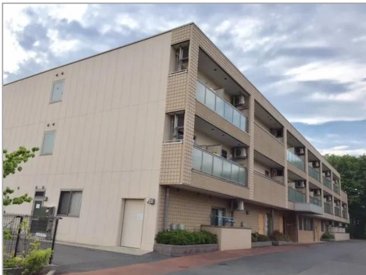
【そんぽの家S玉川上水】外観