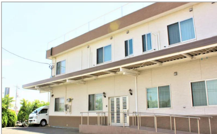
【はなわホームA棟の外観】