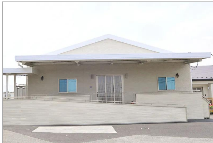
【はなわホームの外観】