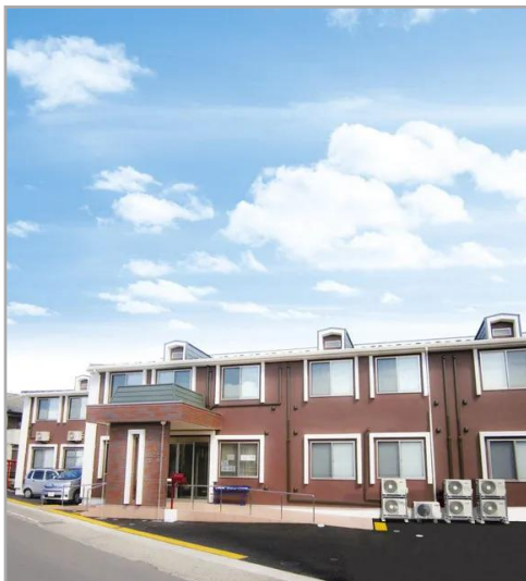
【はなことば足柄】外観