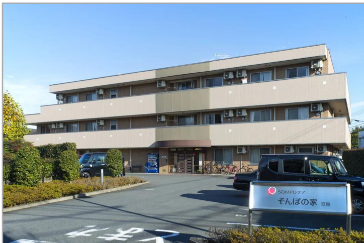
【そんぽの家昭島】外観