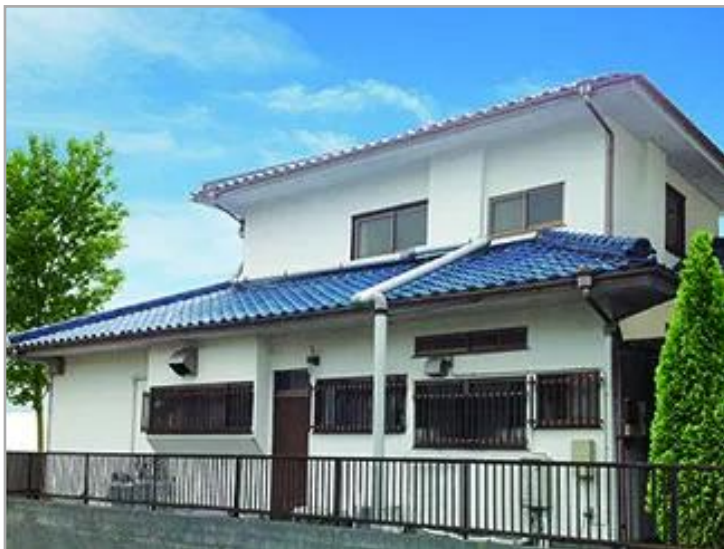
【花物語にのみや】施設外観