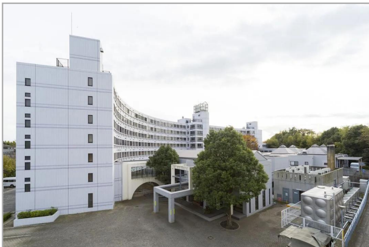
【そんぼの家 市川】外観