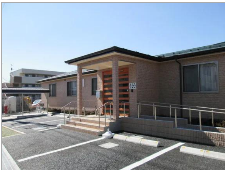
【愛の家グループホーム久喜東の外観】