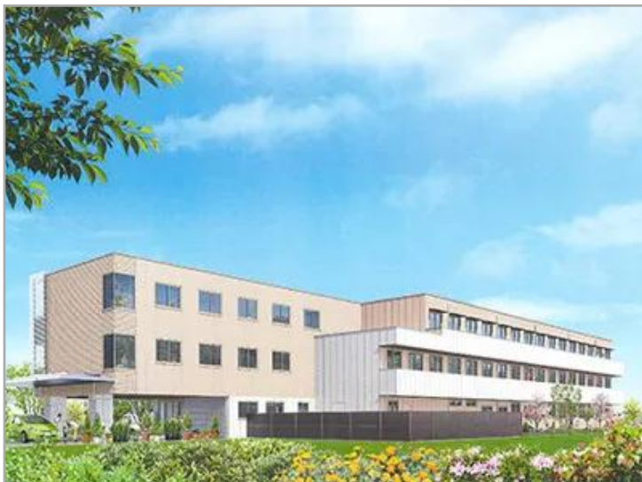
さわやかさがみはら館 外観