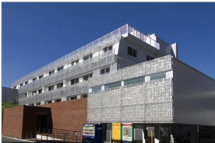
「ウィーザス荻窪」：外観