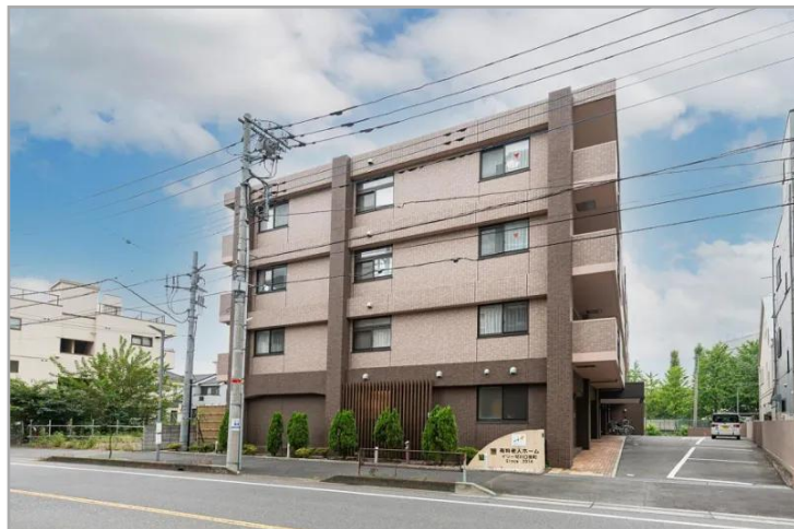
【イリーゼ川口宮町の外観】