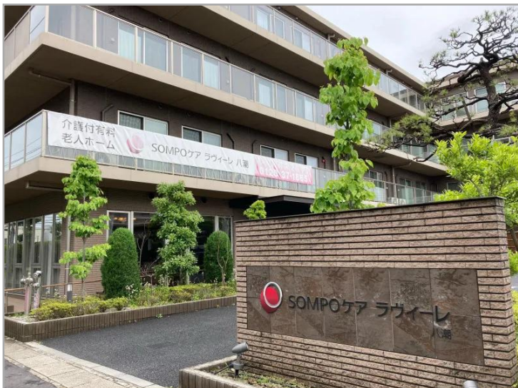
SOMPOケアラヴィーレ八潮 高級感漂う外観