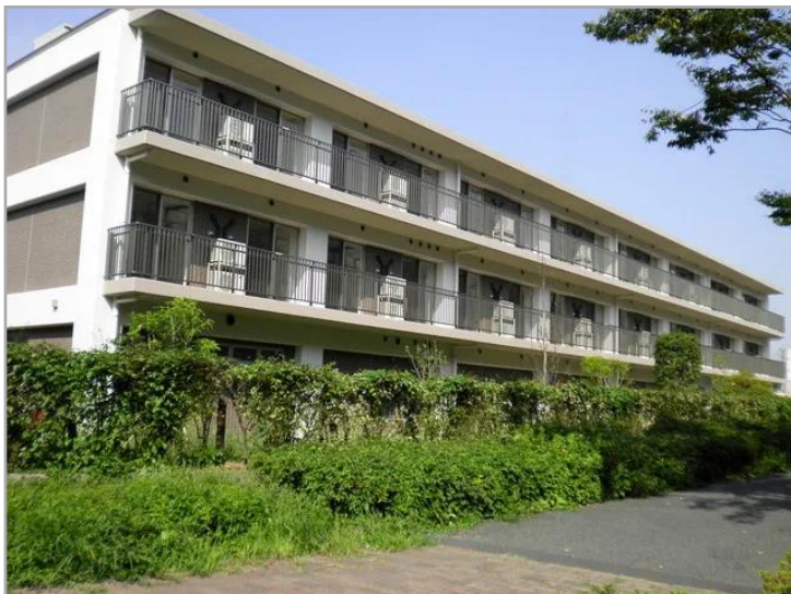
【ベストライフ草加の外観】