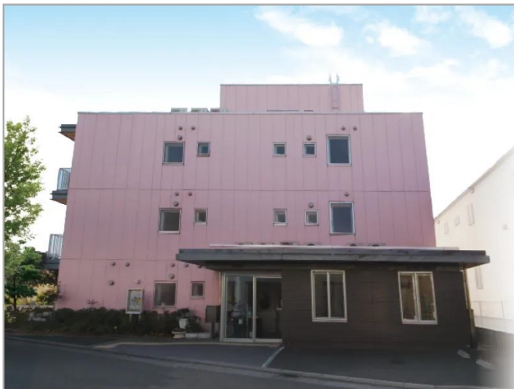
【花物語えどがわ中央・外観】