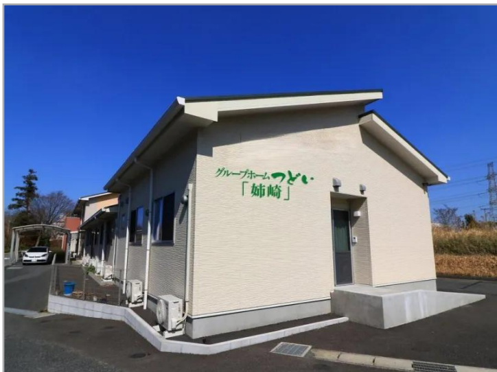
【グループホームつどい姉崎・】