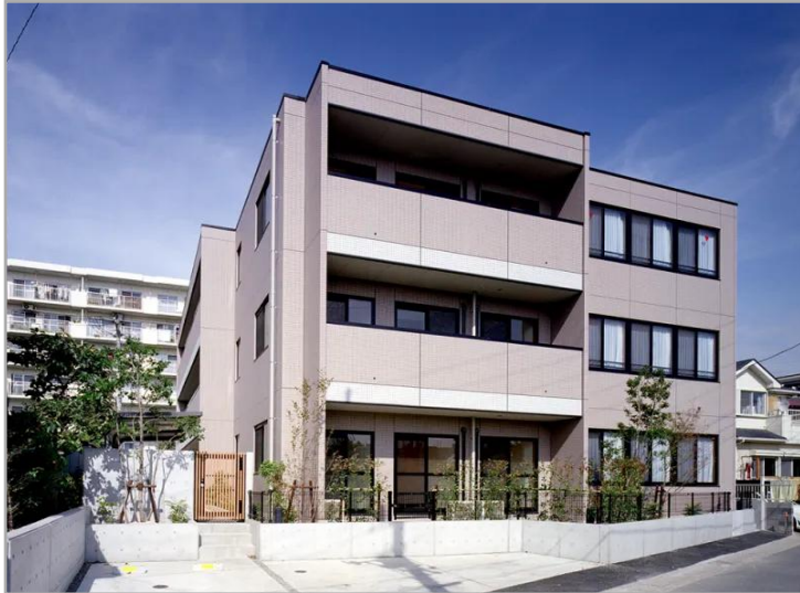
【グループホームきららし川妙典・外観】