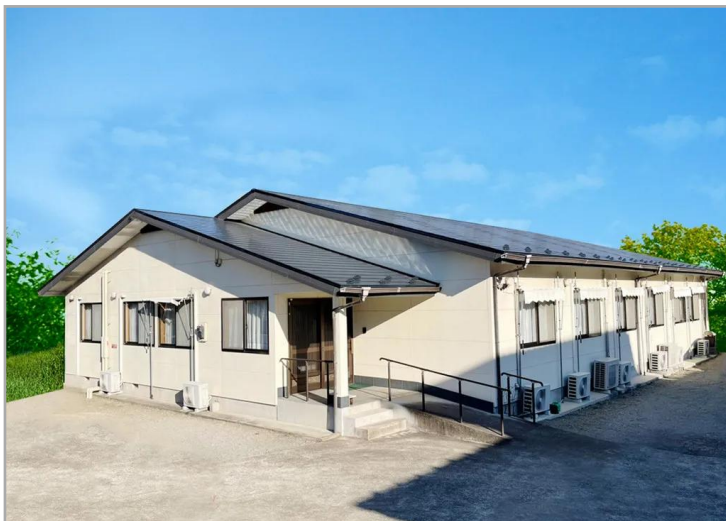
【あんなかの憩の外観】