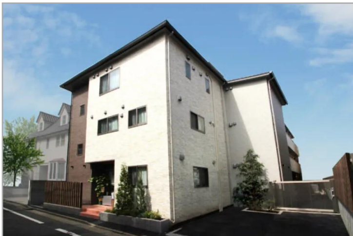
【花物語なかの南の外観】