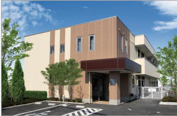
【花物語せたがや南の外観】