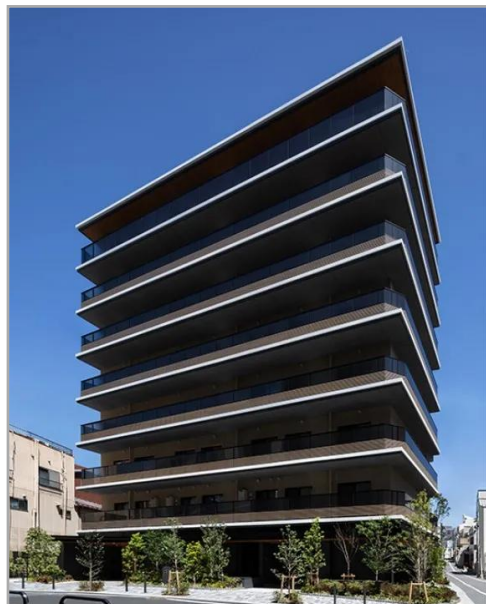
【チャームスイート四谷】外観