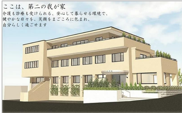
【ヒューマンケアメゾン鎌倉かじわらの里】施設外観イメージ