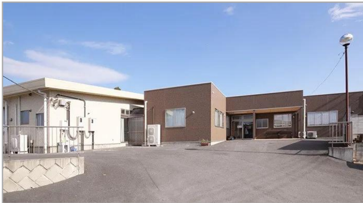
【ヒルズ新里の外観】