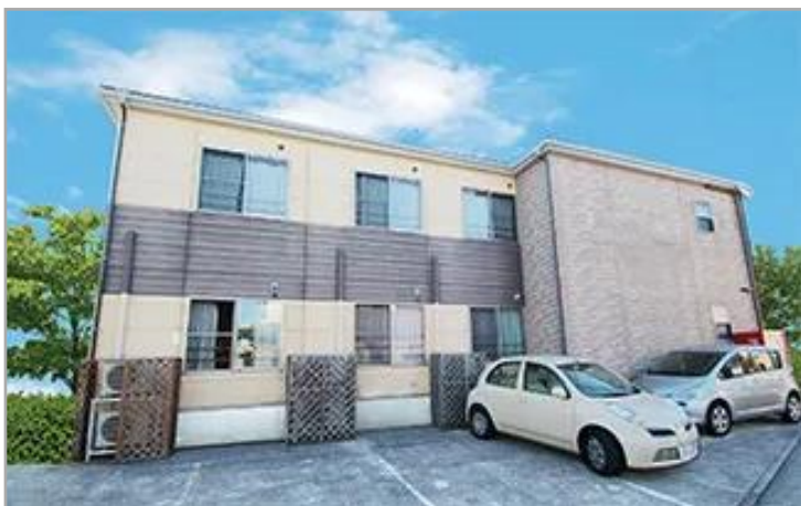
【花物語よこすか東】外観