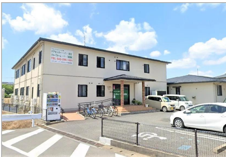
【グループホームつどい荻原家の外観】