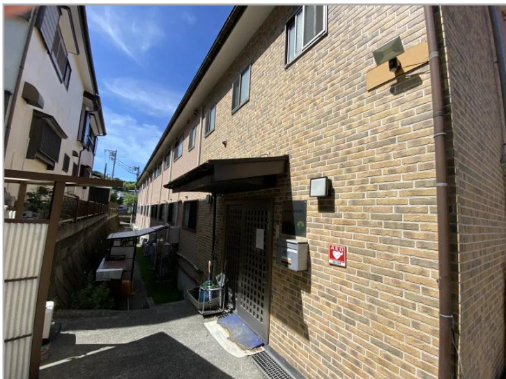
福寿よこすか池上の外観