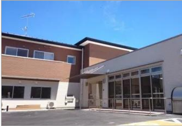
【セントケア鵜沼の外観】