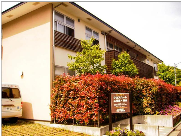
【クロスハート二階堂・鎌倉の外観】