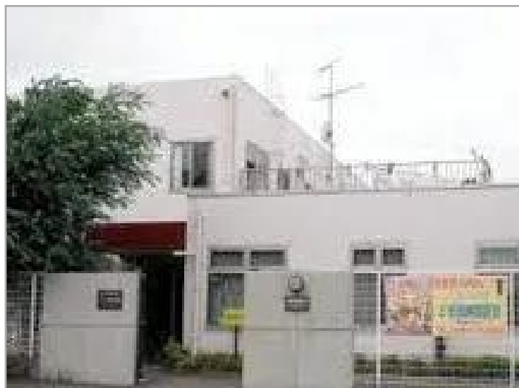
【ミモザ横浜菅田】外観