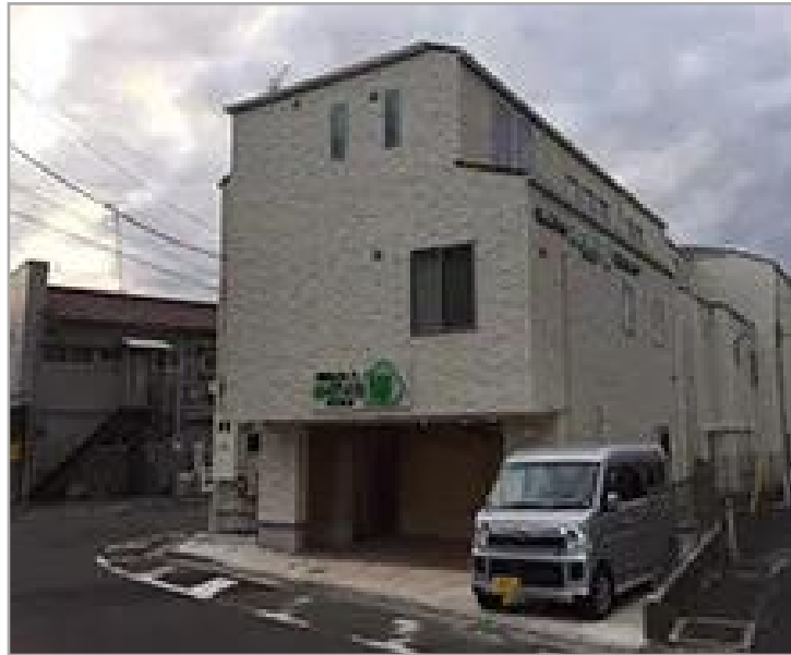
【みどりの郷 横浜鴨居】外観