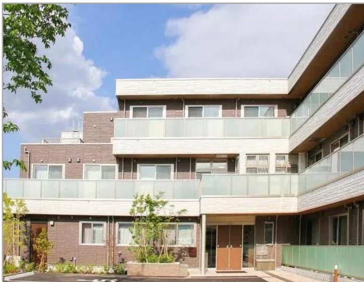
「リアンレーヴー橋学園」外観