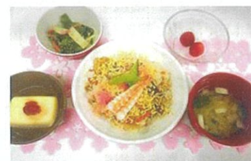
協力法人で提供している食事