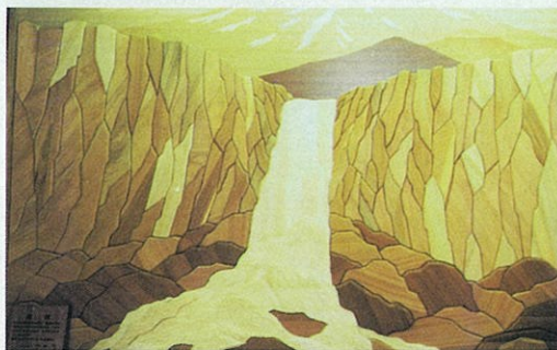
アカマツ、ケヤキ、ヒノキ、などを使った木彫「庵音」が、正面玄関に配されています。ロゴマークとともに施設のシンボルです。

特別養護老人ホームは、介護保険法で要介護度3以上に認定された方で、常に介護を必要とし、ご自宅で介護を受けることの困難な方が入所（住まい）して、入浴・排泄・食事等の介護、趣味活動や日常動作訓練などの支援を受けて生活する施設です。