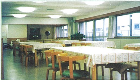
食事は陽射しあふれる食堂で