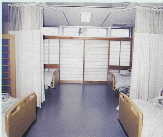
障子を取り入れた和室感覚の居室 室内は自然の素材を数多く採用しています。