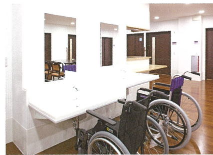
2種類の高さの洗面台をご用意。