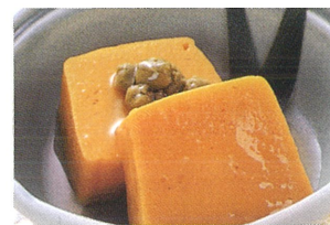
小鉢 かぼちゃの含め煮 【少量高栄養食品】