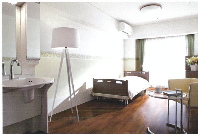
内装のカラーバリエーションは3タイプご用意。