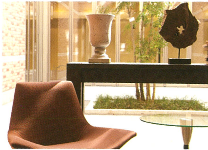
パティオからの柔らかな日差し。