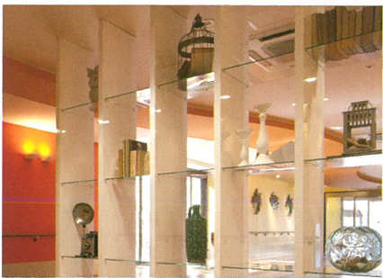
インテリアは、名脇役。