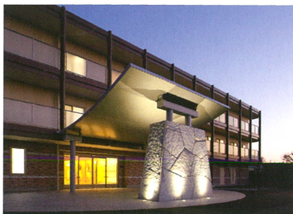
優美な意匠の車寄せ付きエントランス。