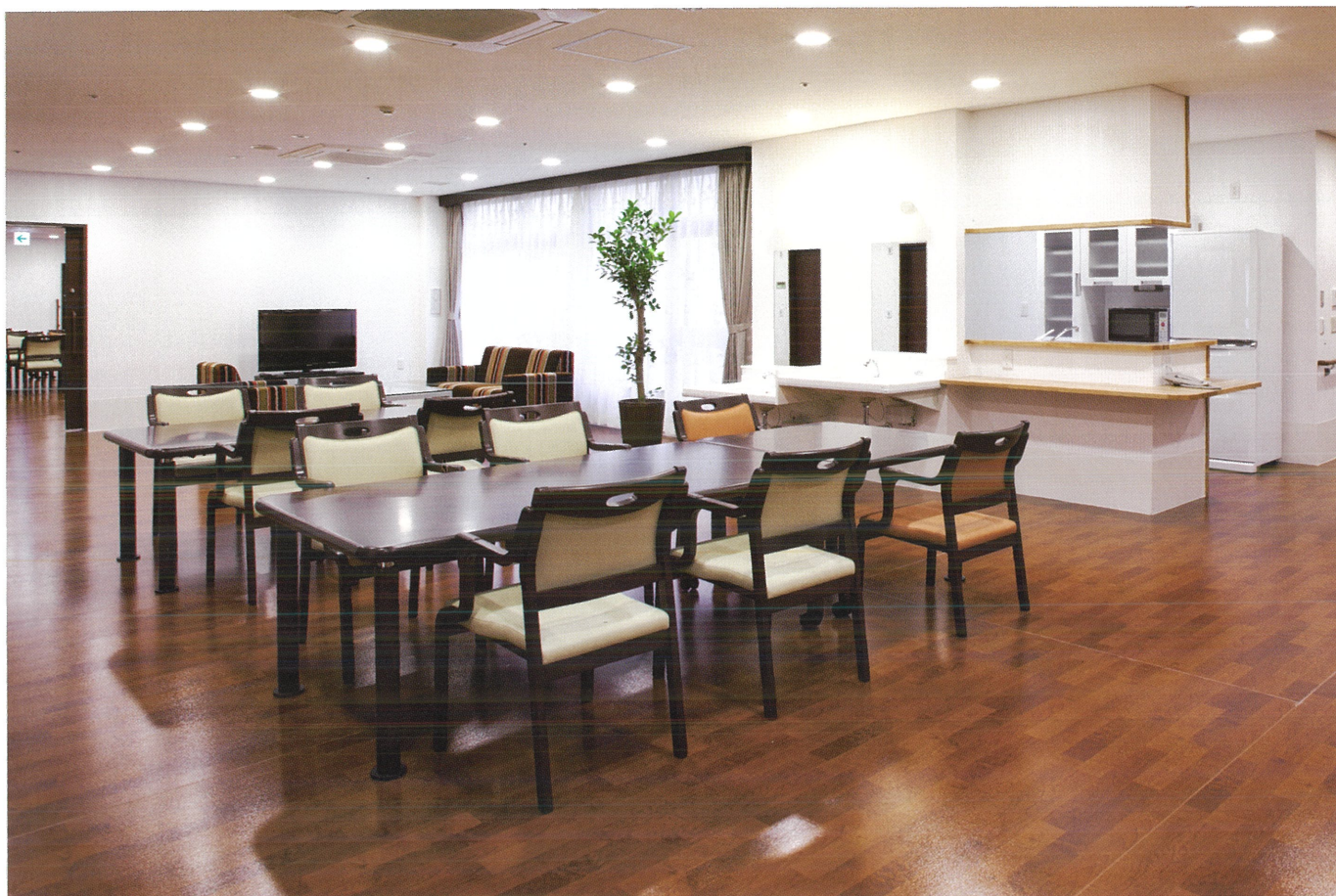
馴染む高さの椅子を選び、テーブルの高さも調整しくつろぐ。