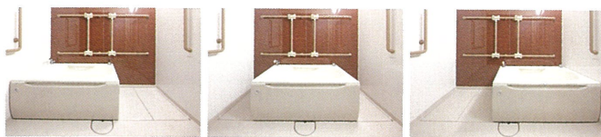
左 中央 右

見た目は普通のユニットバスですが、浴槽が左右に可動す るようになっています。ご入居者のお身体の状況に応じ浴 槽を可動、それに合わせて手すりの位置も動かせるようにな っており、安全に配慮しています。