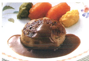
肉料理 ハンバーグステーキ 【少量高栄養食品】

咀嚼（噛む力）・嚥下（飲込む力）の両方の機能が弱くなった方向けに、素材をミキサーにかけ、冷やして固め、あらためて綺麗に成型し盛り付けます。