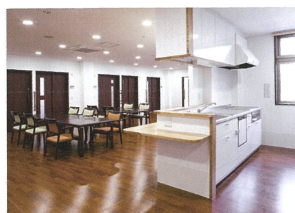
窓付きの明るく開放的なキッチン。