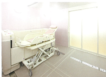
お身体の状況に対応する3タイプの浴室をご用意。