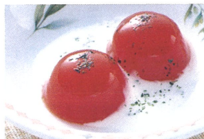
小鉢 トマトサラダ（トマトゼリー） 【形状再生食品】