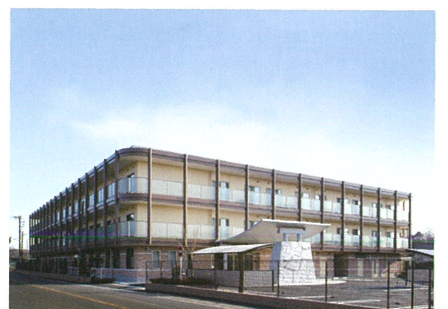
優しいフォルムの外観。