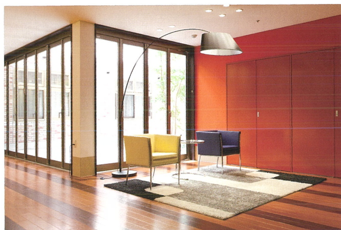
腰を掛け、お喋りをする場所も大切な空間。