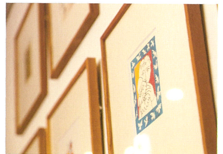
集う方々へ、ギャラリーというおもてなし。