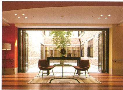
一服の絵画のような風景。