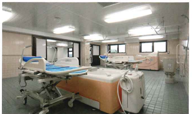
車椅子や寝たままの状態でも入浴ができる特殊風呂も完備。