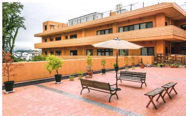
天気のいい日には、テラスのベンチで日向ぼっこやおしゃべりを。