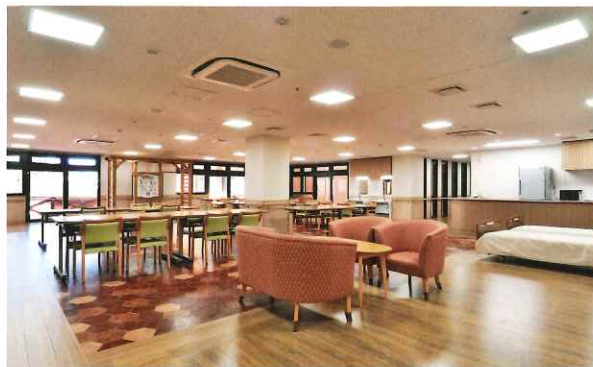
デイサービススペースでは、日々さまざまなイベントを実施。