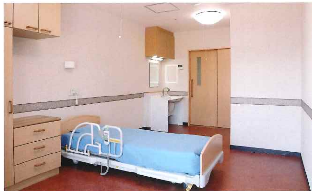
気兼ねなくお過ごしいただける、1名様用の居室。