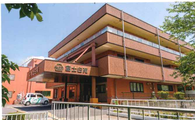
特別養護老人ホームが入っている棟の正面エントランス。

平塚市と大磯町の境にある平塚富士白苑は、海と山を同時に望める絶好のロケーション。屋上にのぼると目の前には相模湾が広がり、背後には緑豊かな湘南平が横たわっています。箱根駅伝や大磯花火大会などを間近で楽しめるのも、平塚富士白苑ならではの。