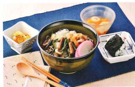
相模湾で獲れた海の幸や、旬の食材を使ったお食事をご用意しています。このお食事は実際にご利用者様にご提供しているものです。