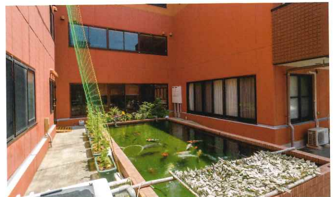
正面エントランスの傍には、錦鯉が泳ぐ池も。