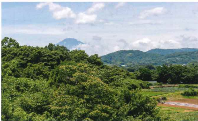
屋上からの眺め。晴れた日には富士山を望みながらリラックス。

2～3階には建物を一周できるベランダもあり、美しい景色に囲まれてのんびりお散歩を楽しめます。