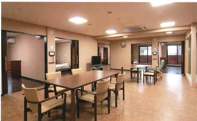
お食事や談笑にご利用いただけるリビングルーム。

居室はすべて個室タイプで、15㎡以上の広々とした空間を確保。 自宅のようにくつろいでいただくため、使い慣れたご自身の家具を持ち込めるようにしています。 茶色と白の清潔感あるデザインと、日差しをたっぷり取り込む大きな窓が特長です。