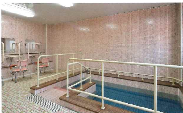
ゆっくりお湯に浸かりながら、心も体もリフレッシュ。