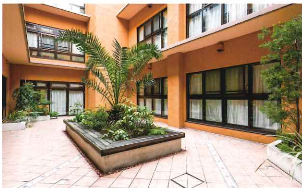
日差しが降り注ぐ中庭は、眺めるだけで開放的な気分に。