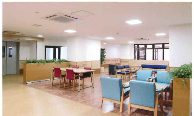
緑に囲まれたロビー。お待ち合わせなどにご利用ください。