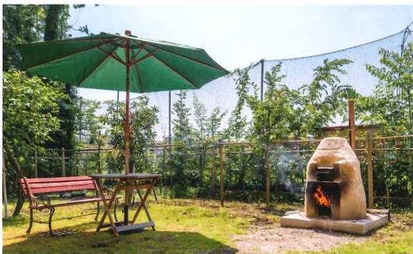
藤沢富士白苑の名物、石窯。ここで焼くパンやキッシュは最高！