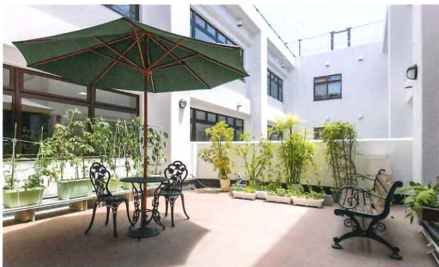
街なかのカフェのようなルーフバルコニーで贅沢なときを。