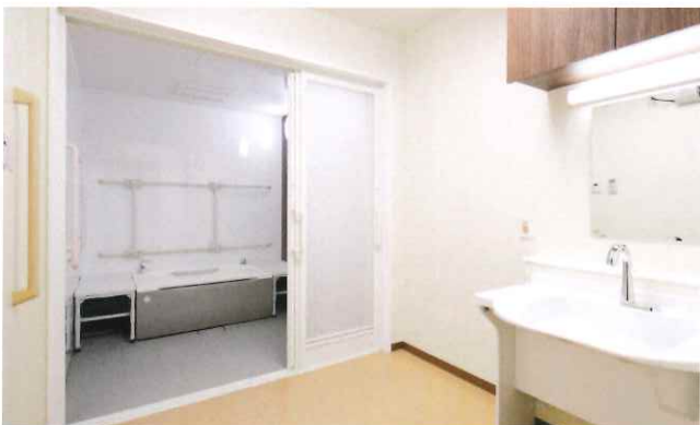
安全に配慮された設計で、リラックスできるバスルーム。