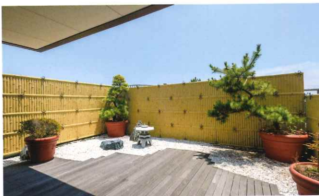
日本庭園を模した中庭。ゆくゆくは足湯も設置する予定です。