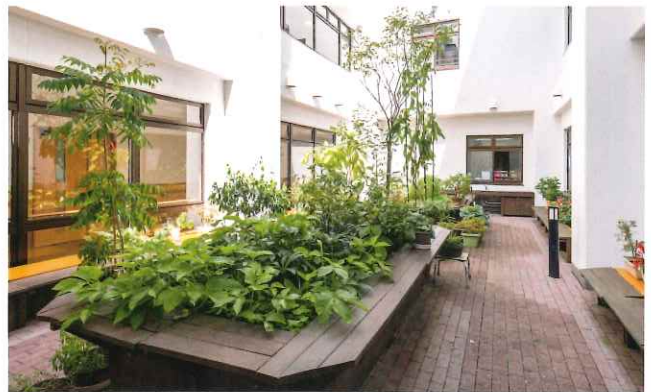
陽の光が注ぐ中庭は、季節の花々や野菜でいつも賑やか。