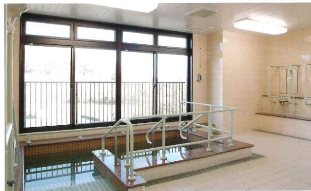
明るいバスルーム。もちろん特殊風呂も完備しています。