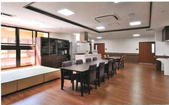
自宅のように使える、アットホームなリビング・ダイニング。

平塚富士白苑と同様、すべての居室が15㎡以上の個室タイプ。 ご自身の家具などを持込み、自宅と同じようにご利用いただけます。 深い茶色を基調とした落ち着いた内装が、お一人おひとりの暮らしにそっと馴染みます。