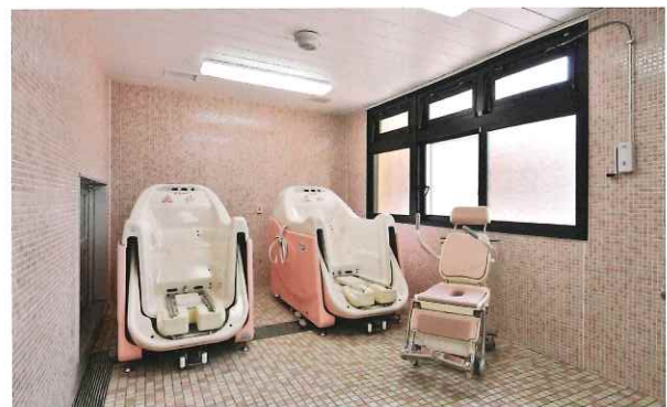
特殊風呂も完備しており、ご利用者様の状況に応じた入浴が可能。