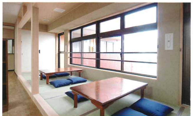
リビングルームには、ほっとひと息つける和室を設けています。