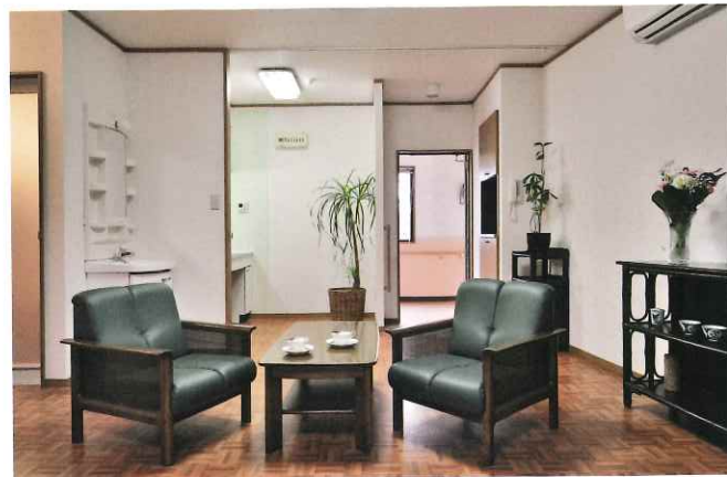
お好きな家具や調度品で、お部屋をアレンジしていただけます。

嘱託内科・消化器科・循環器科による診察(週1回) 心療内科・歯科・皮膚科・眼科による診察(必要に応じて) 定期健康診断 介護職員24時間体制 (玄関・ベッド横・バス・トイレにナースコール設置)