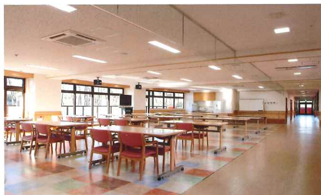
談笑しながらお食事を楽しめる食堂。