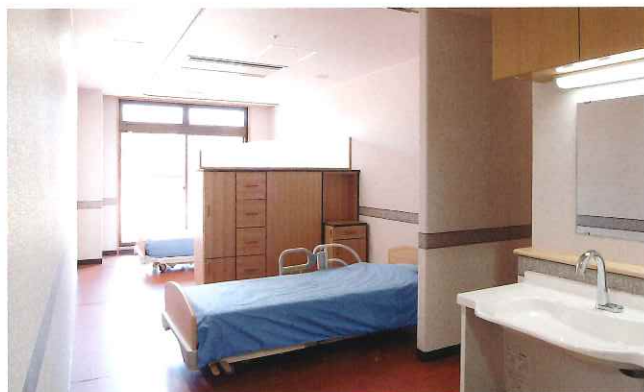
十分な広さを確保した、2名様用の居室。