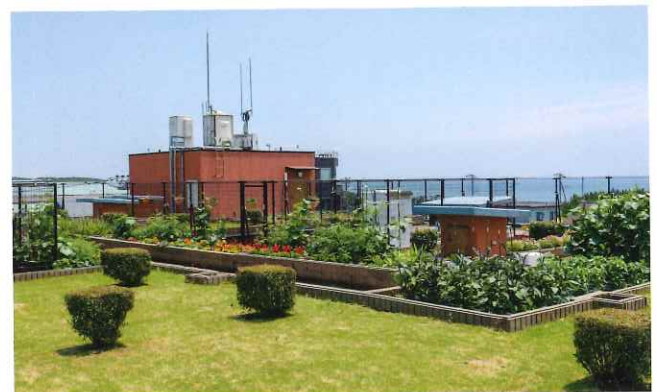
花壇や菜園をしつらえた屋上は、海も山も見渡せる最高の眺め。