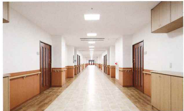
広々とした廊下は、車椅子でも安心して移動できます。